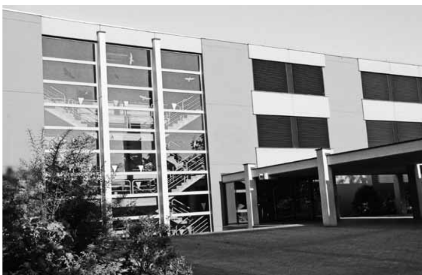
Der Stadt fehlen Steuereinnahmen. Allein die Steuergesetzrevision von 2011 riss ein jährliches Loch von 10 Millionen in die Kasse. Nun wird z.B. durch grössere Schulklassen und grössere Beiträge der SchülerInnen an den Musikunterricht gespart.