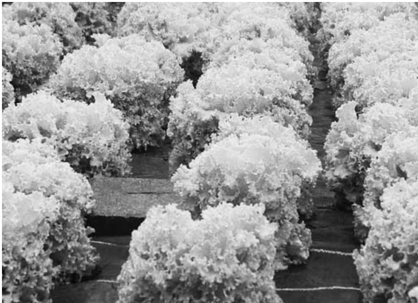
Eine radikale Wende zugunsten einer sozialen und ökologischen Landwirtschaft ist dringend nötig.

Im Plastikmeer von Almeria haben sich viele Grosskonzerne ausgebreitet, die Ausrüstungsmaterial für die Gewächshäuser sowie Dünger, Pestizide und Plastik herstellen. Sie gehören ebenso zu den Gewinnern dieser Entwicklung wie die europäischen Grossverteiler. Diese weigern sich beharrlich, ihre Lieferanten bekannt zu geben. Daher ist es eine mühsame Recherchearbeit, den Weg der Pro-