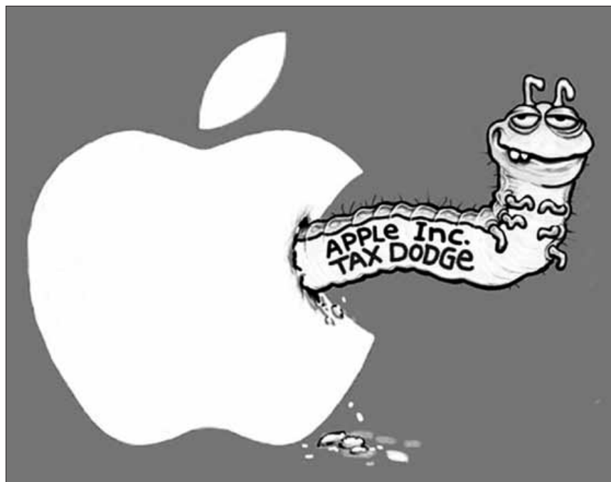
Das neueste Produkt des Apple-Imperiums: iPaynotaxes