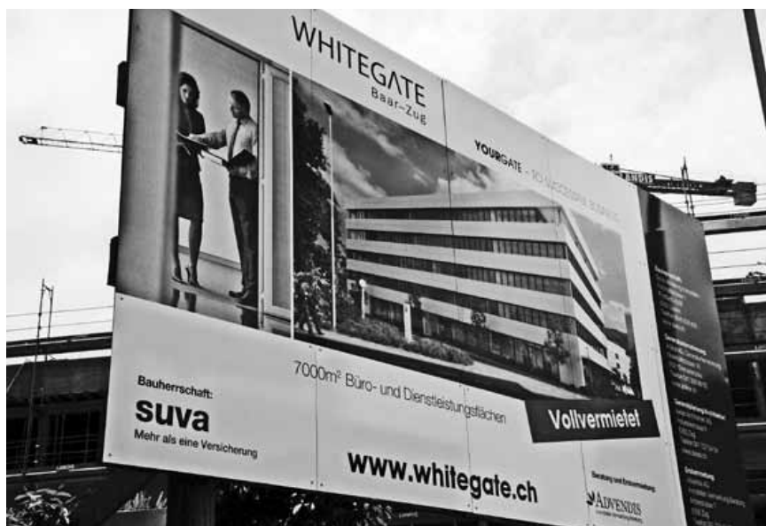
Ein Geschäftshaus: Voll vermietet! Kein Wunder: Zug zieht Firmen an.