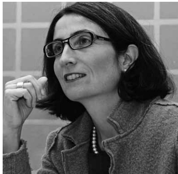
Integration gelingt, wenn sie auf Verbindlichkeit und auf Gegenseitigkeit beruht.

Heute sehen wir, dass dies allein nicht genügt, damit die Integration erfolgreich verläuft. Sehr lange hat die staatliche Seite zu wenig für die Integration getan. Man hat es während vieler Jahre verpasst, die Integration zu fördern, aber eben auch zu fordern. Einige ausländische Mitbewohnende sprechen auch nach vielen Jahren kein Deutsch. Oder sie verstehen unser Schul- und Gesundheitssystem nicht. Es gibt aber auch immer noch Benachteiligungen und