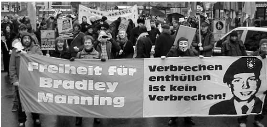
Kundgebung in Frankfurt am Main am 21. Januar 2012