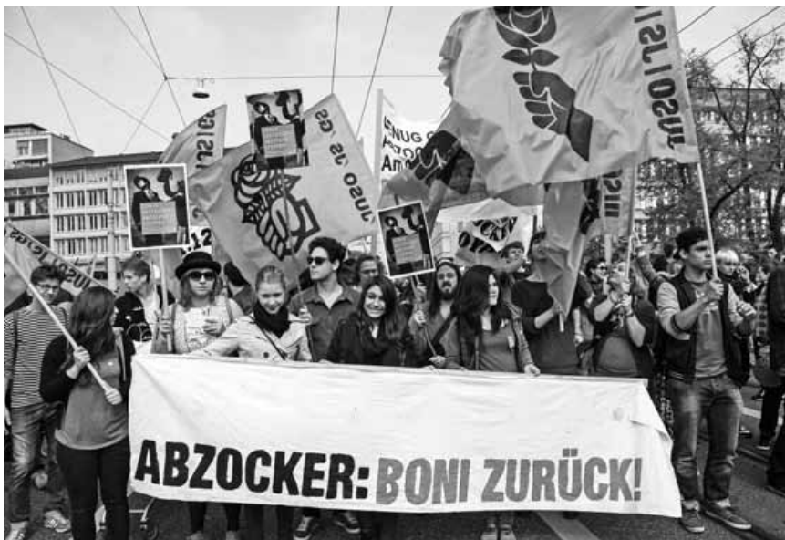
Die 1:12-Initiative – das beste Mittel gegen Abzockerei!

Wenn der Finanzplatz Schweiz wichtiger wird als gute Bildung. Wenn Sparpakete geschnürt werden, welche die Sozialleistungen massiv abbauen. Wenn Vorstösse für mehr Steuergerechtigkeit brutal abgeschmettert werden wegen Erpressungen von selbsternannten Wirtschaftsführern. Dann leben wir in den Zwängen eines Wirtschaftssystems, in dem ein Prozent gleich viel besitzt wie die restlichen 99 zusammen. Sogenannten «Leistungsträgern» werden ständig neue Privilegien gewährt, während 231'000 Schweizerinnen und Schweizer mit einer Vollzeitarbeitsstelle ihren Lebensunterhalt nicht bezahlen können. Doch wir haben Antworten für mehr Gerechtigkeit in der Schweiz – eine davon ist die 1:12-Initiative.